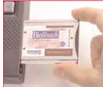
1. Inserte el lector BioTouch PC Card