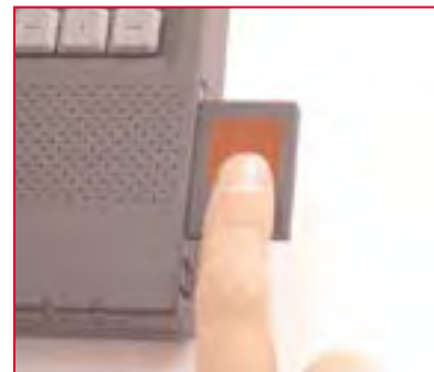
3. Ponga su dedo sobre el lector